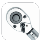
Трещоточный механизм с кнопкой